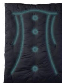
〔特殊キルト〕 「Body Line AiR Quilt」